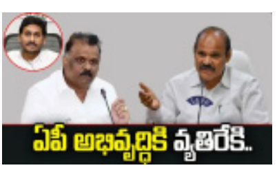
ఏపీ అభివృద్ధి వ్యతిరేకి.

అమరావతి, ఫిబ్రవరి 17 వైసీపీ అధినేత వైఎస్ జగన్ మోహన్ రెడ్డిపై ఏపీ మంత్రి కొలుసు పార్థసారథి తీవ్ర ఆగ్రహం వ్యక్తం చేశారు. జగన్ రెడ్డి అభివృద్ధి వ్యతిరేకి అని మరోసారి నిరూపితమైందని విమర్శించారు. బిల్ గేట్స్ అమరావతి పర్యటనపై జగన్ విషం కక్కుతున్నారని ధ్వజమెత్తారు. జగన్ బద్దే పాలన దీర్ఘకాలిక సంతకమని ఎద్దేవా చేశారు. కూటమి పాలన కన్స్ట్రక్షన్ నిదర్శనమని ఉద్ఘాటించారు. అమరావతి వేదికగా మంత్రి కొలుసు పార్థసారథి మీడియాతో మాట్లాడారు. కూర్చోవేతల ఆలోచన ఉన్న జగన్ రెడ్డి.. అమరావతి నిర్మాణం జరుగుతుంటే ఓర్వకోలేకపోతున్నారని మంత్రి పార్థసారథి ధ్వజమెత్తారు. కూటమి ప్రభుత్వం, ముఖ్యమంత్రి చంద్రబాబు విజన్ ను బిల్ గేట్స్ పొగడటంతో జగన్, సాక్షి మీడియా విష ప్రచారానికి పూనుకున్నారని ఫైర్ అయ్యారు. ఏపీ బాగుపడడం జగన్ కు ఏమాత్రం ఇష్టం లేదని.. అందుకే తన అనుచరులతో బిల్ గేట్స్ పర్యటనపై బురద చల్లిస్తున్నారని మండిపడ్డారు. ఎవరు ఎన్ని దుష్ప్రచారాలు చేసినా.. అభివృద్ధిలో వెనకడుగు వేసే పరిస్థితి లేదని స్పష్టం చేశారు. జగన్ రెడ్డి అండ్ కోకి ప్రజలే తగినవిధంగా బుద్ధి చెబుతారని హెచ్చరించారు.